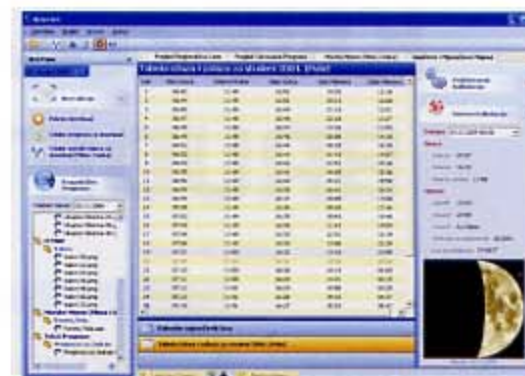
■ Izračun izlaska i zalaska sunca i mjeseca za tekući mjesec i prikaz mjesecove faze za odabrani datum u tabeli

Tu je još prava 'gomila' drugih meteoroloških podataka i prognoza koje možete skinuti s interneta: podaci o temperaturi mora i sedmodnevna prognoza njezinog kretanja, opća prognoza za pomorce, nautička prognoza za